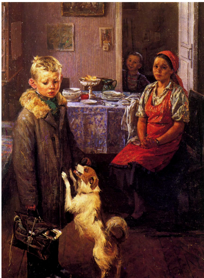
Ф.П. Решетников «Опять двойка!», 1951 г.